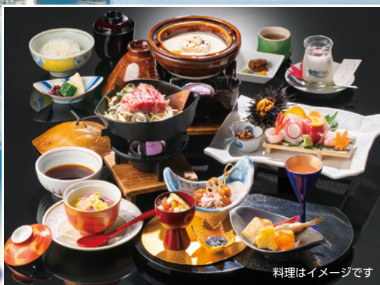
料理はイメージです

おもてなし日本一の老舗旅館 加賀屋 または 姉妹館 茶寮の宿あえの風 からお選び下さい。