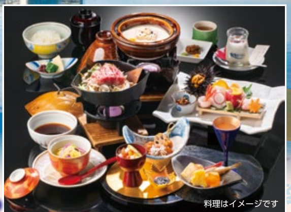
料理はイメージです

おもてなし日本一の老舗旅館 加賀屋 または 姉妹館 茶寮の宿あえの風 からお選び下さい。